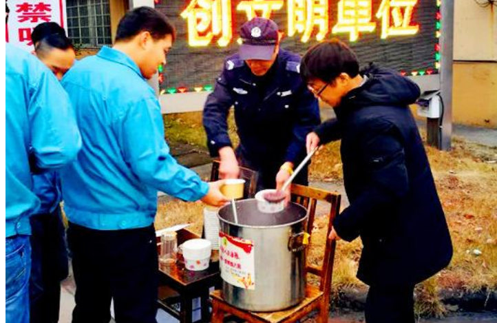
“腊八节”，古越龙山酒厂分工会、鉴湖公司领导班子为奋战在生产一线的员工送去暖暖的腊八粥，在寒冷的冬日送上一份问候与关怀。

2月2日，第五届浙江省企业文化建设大会在慈溪市隆重举行，会上表彰了一批浙江省企业文化建设先进集体和个人，黄酒集团荣获浙江省企业文化品牌建设优秀单位。