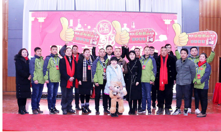
2月3日，安徽淮南远大商厦举办“古越龙山迎春产品订货会”，300余位嘉宾齐聚一堂，品鉴美酒，分享经验，共话发展。现场气氛十分热烈。经销商一个个信心十足，表示要打好节前旺季销售这一仗。