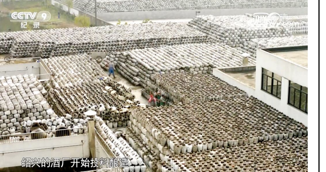
这些意义非凡的食物