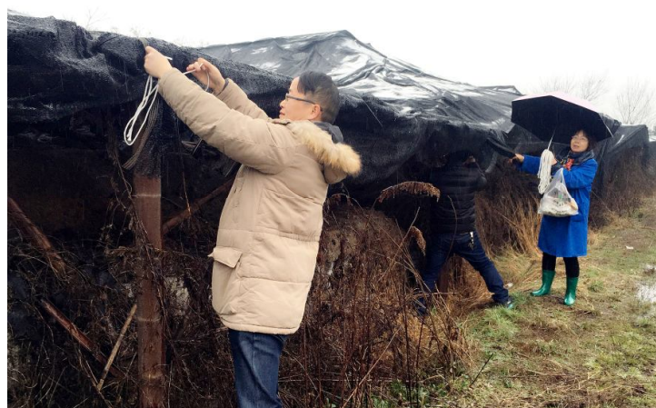
针对低温雨雪天气，物流中心会同保险公司，加强对外租农村仓库的现场巡查，发现问题及时排除，最大程度减少恶劣天气影响，确保公司财产安全。（王立娟/物流中心）